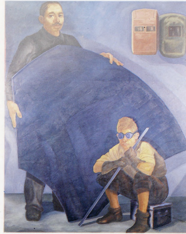
"Usta-Çırak" 1985, 200x160 cm, tuval üzerine yağlıboya.