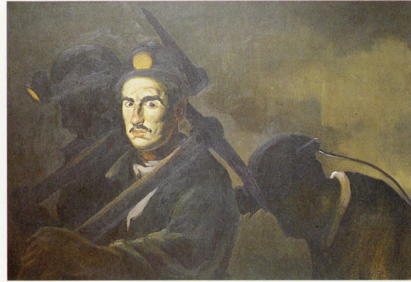
"Madenci" 1987, 70x100 cm, tuval üzerine yağlıboya.

Oysa gerçekte eskiyen ve misyonunu yitiren Resim Sanatı değil ona bakış açısidir. Moda dünyasının beklentilerini doyurmaya yönelik kronolojik-tarihsel bakış açısı ard-zamanlı bir tüketim anlayışının uzantısıdır. Bu ortamda niteliksel, lirik ve insancıl bakış açısını ayakta tutmaya çalışmak Resim sanatında ilerlemenin tek alternatifi olmayabilir ama en önemlisidir.