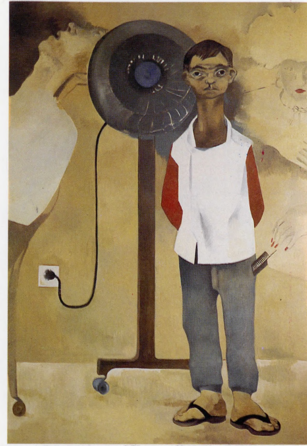
"Berber Çırağı" 1989, 190x135 cm, tuval üzerine yağlıboya.

1982 Yarışması (mansiyon) Vakko Resim Yarışması Sergisi (mansiyon) 1987 Sanfa Sanat Galerisi, İstanbul (kişisel sergi) 1987 Tanbay Sanat Galerisi, Ankara (karma sergi) 1988 Kayaalp Sanat Galerisi, İstanbul (karma sergi)