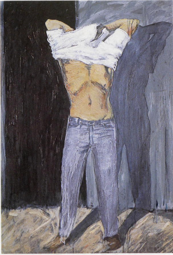
"Soyunan" 70x100 cm, tuval üzerine yağlı boya.