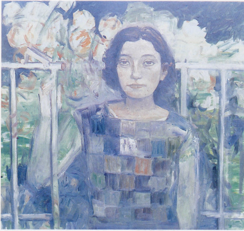
"Bahçe Kapısında" 1988, 90x100 cm, tuval üzerine yağlıboya.