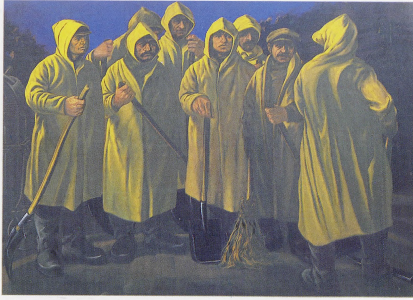
"Çalışan Arkadaşlar", 1989, 130x180 cm, tuval üzerine yağlıboya.