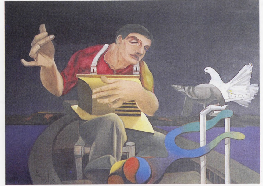
"Siyah-Beyaz İkili" 1988, 100x135 cm, tuval üzerine yağlıboya.

Sanfa Sanat Galerisi, İstanbul sergilerine katıldı. Sanfa Sanat Galerisi'nde ilk kişisel sergisini açtı.