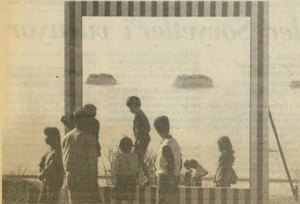
DANIEL BUREN'İN BİR ÇALIŞMASI — 1. Uluslararası Plastik Sanatlar Festivali'nde Aya İrini'de bir çalışma gerçekleştirmesi beklenen en ünlü yabancı sanatçılarından biri de Daniel Buren. Geçen mart ayında Paris'teki Dekoratif Sanatlar Müzesi'nde bir sergi düzenleyen Buren, 1985'te de Japonya'da "Manzarayı Ödünç Almak" adlı bir çevre düzenlemesi gerçekleştirmişti.

15 Eylül-15 Kasım tarihleri arasında gerçekleştirilmesi tasarlanan 1. Uluslararası Plastik Sanatlar Festivali'nde, uluslararası sanat ve kültür etkinliklerinin üst düzeyde bir kesitinin yurdumuzda sergilenmesi, her ülkenin belirginleşmiş, güncel sanat anlayışıyla ülkesinde ya da uluslararası sanat ortamında sanatın gelişimine katkı getiren sanatçıların tanıtılması ve bu olayın uluslararası bir izleyici, alıcı, koleksiyoncu kitlesine sunulması amaçlanıyor.