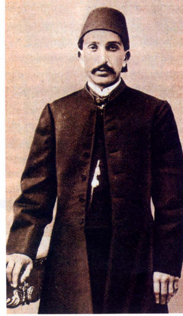
Namık Paşa'nın hizmet ettiği üç padişah: II. Mahmud, Abdülaziz ve II. Abdülhamid.

II. Mahmud ve Abdülhamid'in resimleri: Sultan Abdülmecid, Necdet Sakaoglu-Nuri Akbayar; Abdülaziz'in resmi Vasilaki Kargopulo Bahattin Öztuncay'dan alınmıştır.